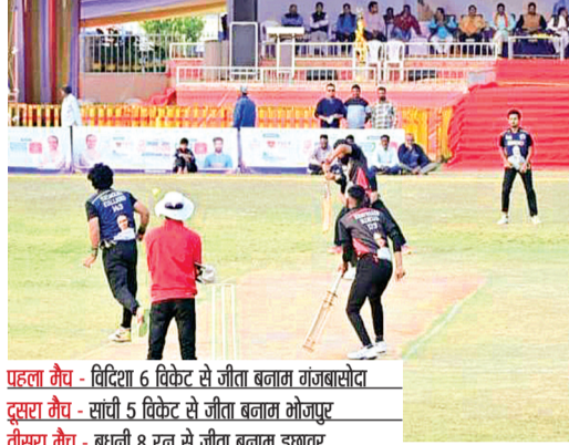
पहला मैच - विदिशा 6 विकेट से जीता बनारस गंगवासीय दूसरा मैच - सांची 5 विकेट से जीता बनारस गंगवासीय तीसरा मैच - बुधनी 8 रन से जीता बनारस गंगवासीय चौथा मैच - सिलवानी 47 रन से जीता बनारस गंगवासीय पांचवा मैच - बुधनी 8 रन से जीता बनारस गंगवासीय

विगत एक माह से चल रहे सांसद खेल महोत्सव समापन के प्रथम दिवस के अवसर पर स्थानीय खेल स्टेडियम में सांसदीय क्षेत्र की आठ विधानसभाओं से आए खिलाड़ियों ने अपना दम दिखाया। वहीं खेल प्रेमियों में काफी उत्साह देखा गया। इस अवसर पर सांसदीय क्षेत्र के दिग्गज उपस्थित रहे। मैदान को रोशन करने 6 बड़े हैलोजन टावर लगाए गए हैं।